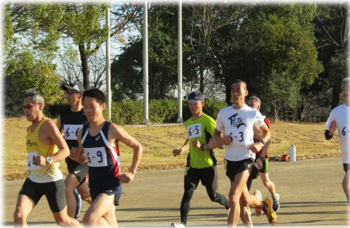
かわじまランニングフェスティバル（平成の森公園）