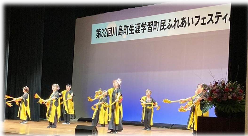
川島町生涯学習町民ふれあいフェスティバル（町民会館）