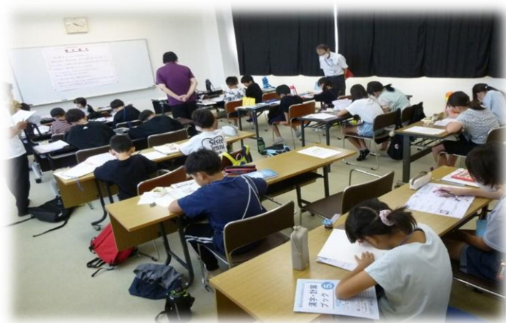
宿題サポート事業（図書館）