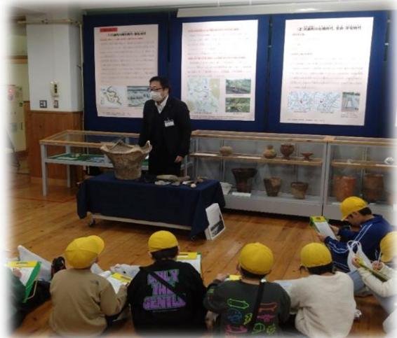
かわじま郷土資料展示室（旧小見野小学校）