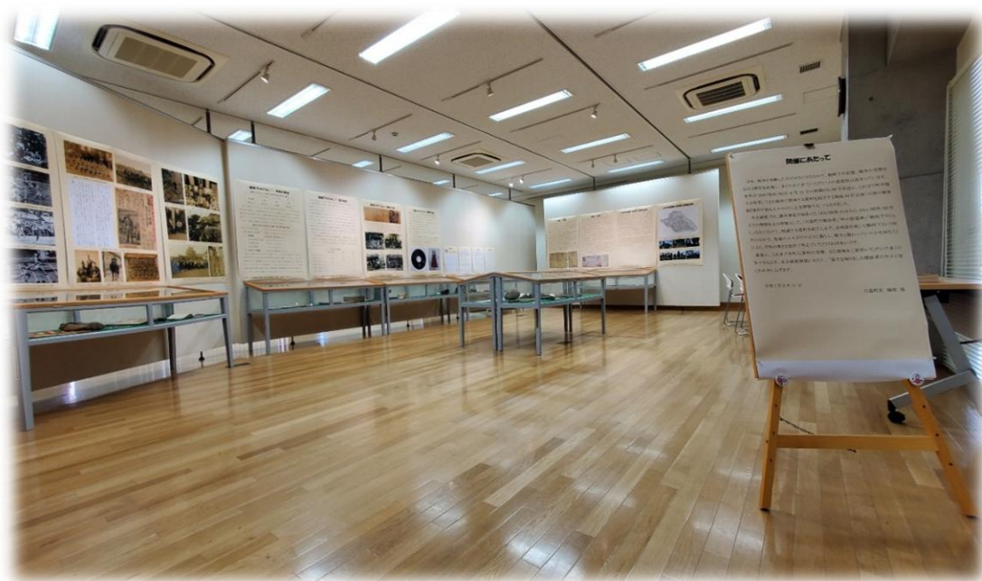
戦後80年企画「川島の戦争展」(川島町役場 多目的室)

本計画は、前述による進行管理と評価を行うとともに、国の動向や埼玉県あるいは他市町村の取り組み状況などを勘案し、必要に応じて適宜見直すことといたします。