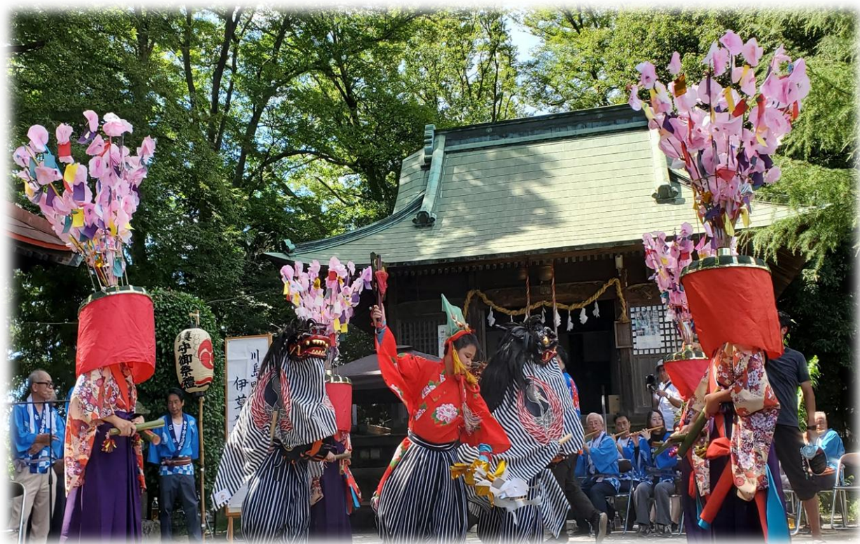
伊草獅子舞（伊草神社）